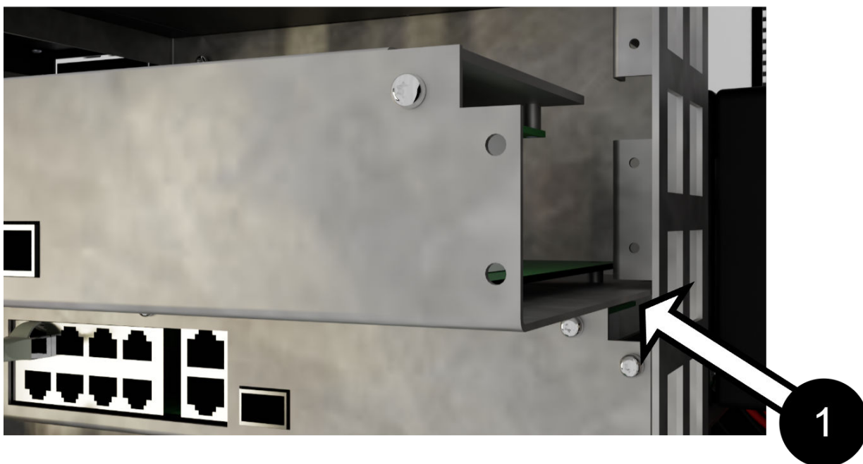
Tabell 3. Montering